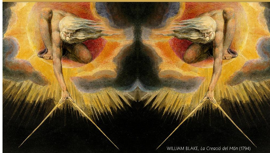
WILLIAM BLAKE, La Creació del Món (1794)