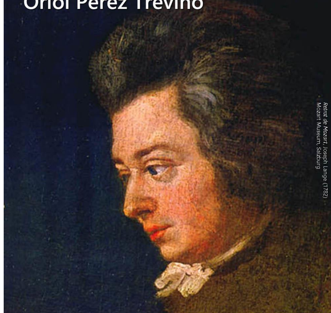
Retrat de Mozart, Joseph Lange (1782) Mozart Museum, Salzburg

13 de setembre de 2019, 16h · Santa Cecília de Montserrat